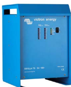
Skylla TG 24 100